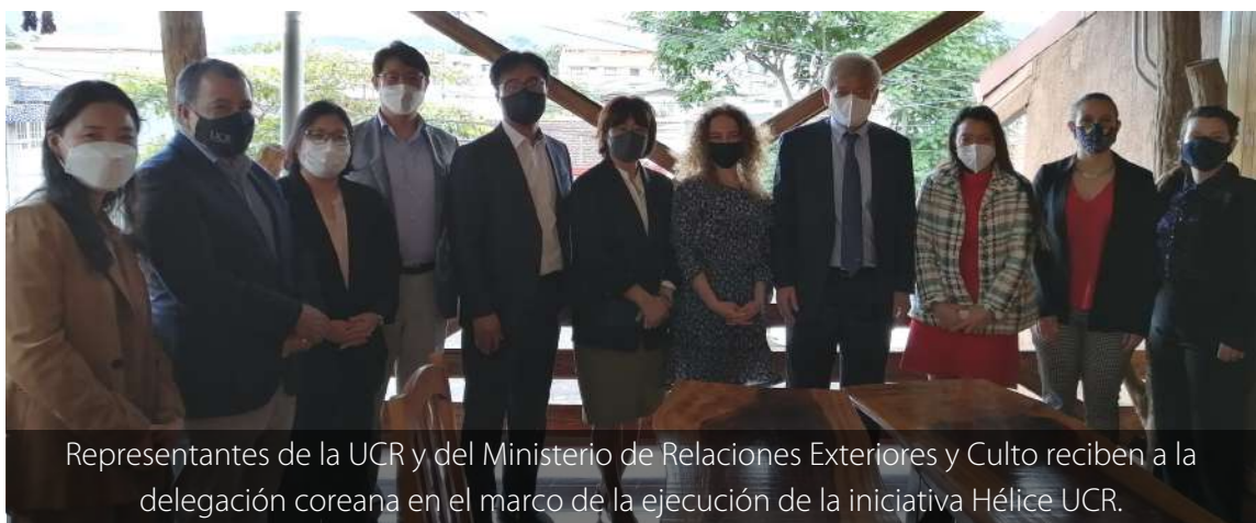
Representantes de la UCR y del Ministerio de Relaciones Exteriores y Culto reciben a la delegación coreana en el marco de la ejecución de la iniciativa Hélice UCR.