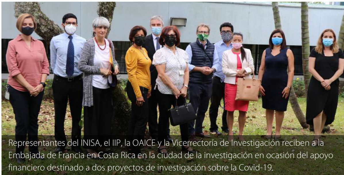
Representantes del INISA, el IIP, la OAIICE y la Vicerrectoría de Investigación reciben a la Embajada de Francia en Costa Rica en la ciudad de la investigación en ocasión del apoyo financiero destinado a dos proyectos de investigación sobre la Covid-19.

El proyecto "Estrés agudo y respuesta de adaptación de los costarricenses en el contexto de la pandemia COVID-19: un estudio exploratorio" es impulsado por el Instituto de Investigaciones Psicológicas (IIP) -con otros centros de investigación de la UCR- y tiene como objetivo caracterizar las manifestaciones de salud mental en el contexto de la emergencia nacional por la pandemia de COVID-19, a partir de factores sociodemográficos y variables psicosociales.